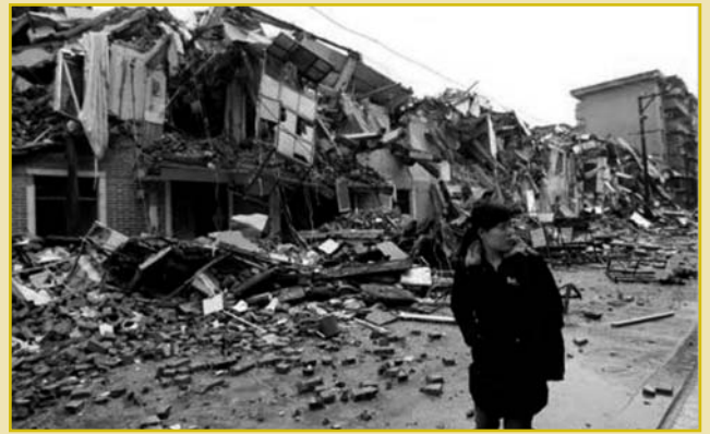
Πόλεις κοντά στο επίκεντρο ισοπεδώθηκαν και ολόκληρα βουνά κατέρρευσαν.