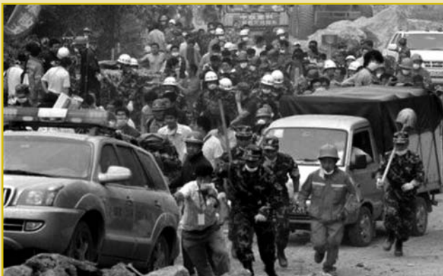
Ο εθνικός δρόμος προς την πόλη Ντουτζιανγιάνγκ κατακλύστηκε μία ώρα μετά το σεισμό, όχι από ανθρώπους που προσπαθούσαν να φύγουν μακριά από το επίκεντρο, αλλά από εθελοντές που με 1000 αυτοκίνητα ταξί έτρεξαν από το Τσενγκντού για να βοηθήσουν.