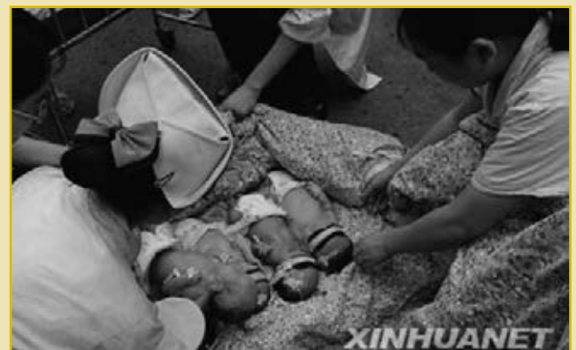
Οι νοσηλευτές και οι γιατροί παρείχαν υπηρεσίες κάτω από πολύ δύσκολες συνθήκες. Πολλά νεογέννητα ήρθαν στο φως μέσα στα χωράφια.