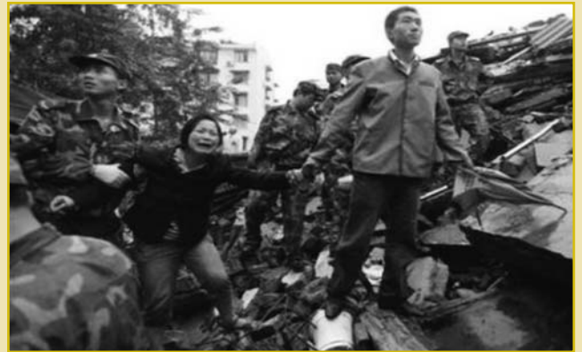
Εκατομμύρια άνθρωποι έχασαν αγαπημένα τους πρόσωπα, σπίτια και άλλα υπάρχοντα. Παρόλα αυτά δεν σημειώθηκε καμιά λεηλασία και δεν ακούστηκε κανένας γογγυσμός. Απλώς οι άνθρωποι βοηθούσαν ο ένας τον άλλο