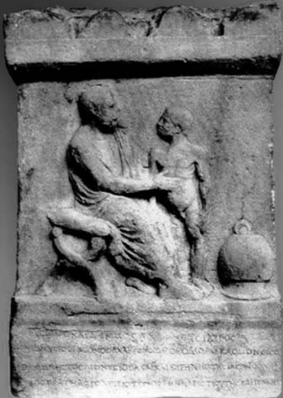
Επιτύμβια στήλη του Αθηναίου Ιατρού Ιάσωνα, 2ος αι. π.Χ., Βρετανικό Μουσείο-Λονδίνο «Επίσφιζοντες και πρός υμῶν να με θέτε. Μοῦ σου ἐκάτ' φοιτῆτες. Ὀ, Σύμμαχε! Ἐκάτ' παλαιὸν δάκτυλό με ἐξέτισσον. Ὅταν πρός Σύμμακα δέν εἶνα παρτά, τῶρα ἄνωξ' ἔλα.» M. Valerius Martialis, 40-98 μ.Χ., Ρωμαῖος ἐπιγραμματολόγος ἀπ' τὴν Ἰσπανία

14 ▶ 15 Νοεμβρίου 2008 Ξενοδοχείο Classical Athens Imperial