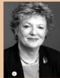
Η νέα Πρόεδρος του ICN