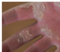
ΠΡΙΝ ΤΗ ΧΡΗΣΗ

κάτι που μπορεί να επηρεάζει σημαντικά την ποιότητα ζωής τους και μπορεί να οδηγήσει σε μειώσεις της δόσης ή ακόμη και διακοπή της αντικαρκινικής θεραπείας τους.